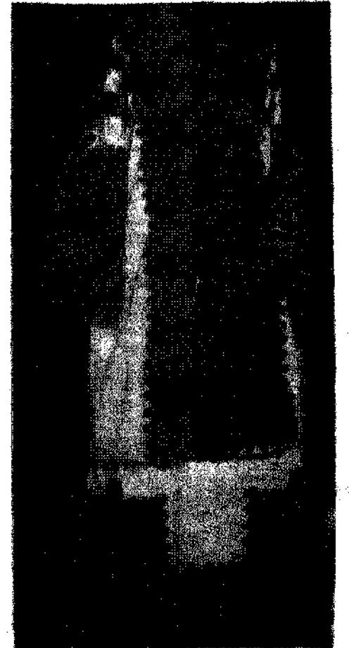
Κρηνητής. Πρωτογενής. Μουσείο Μπενάκη. Αναφέρει ενδεικτικά ηπειρωτικές και νησιωτικές περιοχές (αστικές και αγροτικές) που κρηνησαν ενδυματολογικά από τους φοιτητές μας: Κοζάνη, Έβρου, Τρίκαλα, Φάρσα, Ελευσίνα, Αράχθια, Ζαγόρα, Αγιοσταυρό Καρδίτσας, Μεγαλοχώρι Τρικάλων, Δεσφίτη Γρεβενών, Άνω Πύλη Πρέβεζας, Ριλιόβι Πρέβεζας.

ρωνας και λαϊκή μας πολιτισμού. Έκ των προτέρων τους διδονται οδηγίες και γίνονται πολλές συζητήσεις - και κατ' ίδιαν μαζί τους για την ερευνητική κορεία που πρέπει να ακολουθήσουν για την εκλογή του τόκου έρωνας, το είδος της φορεσιάς, την ακριβή τοποθέτηση της στο χώρο και το χρόνο, τις ιστορικές κοινωνικές συνθήκες που τη διαμόρφωσαν - κι ακόμη για την προσέγγιση υλοδοξιών πληροφορητών, τη συνταξη ερευνηματολογίου για τη συλλογή του ζητούμενου υλικού, τέλος για τη σύνθεση και παρουσίαση του υλικού από τον πρόλογο και την εισαγωγή ως τα συμπεράσματα και τη γλωσσόρια.